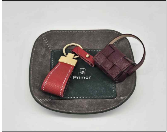
가죽 트레이 - 5~6주차