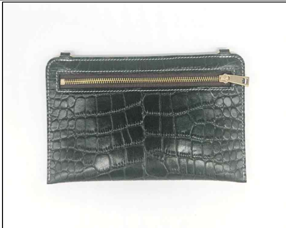
지퍼 포켓 클러치 - 11~12주차