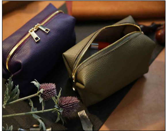
사각 파우치 - 9~10주차