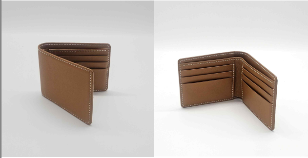
남자반지갑 - 1~5주차