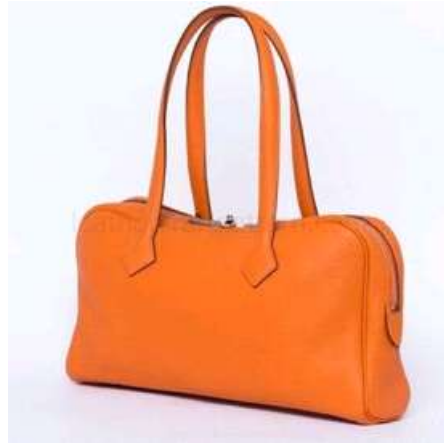
빅토리아백 - 6~12주차