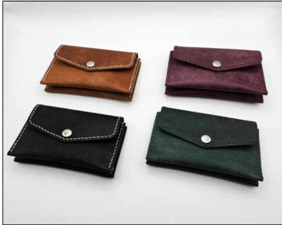
똑딱이 아코디언 - 7~8주차