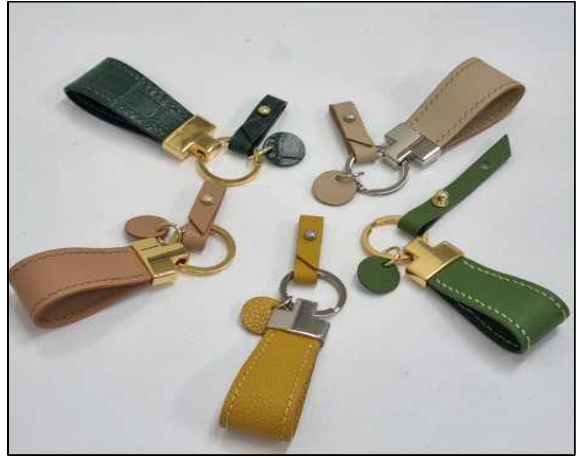
T자 키링 - 2주차