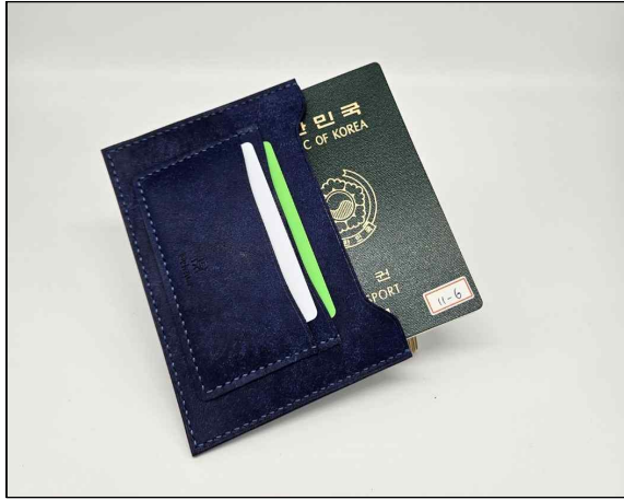
여권지갑 - 3~4주차